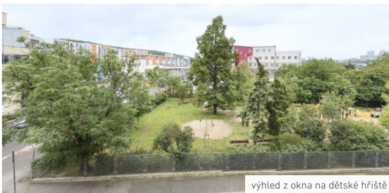
výhled z okna na dětské hřiště